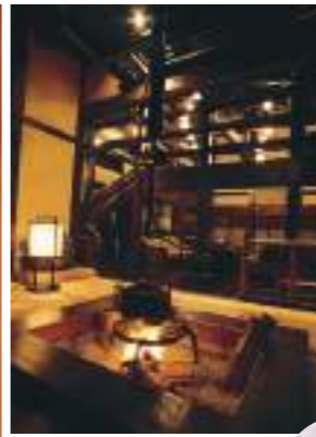
田舎裏では奥美濃の川魚や山菜、地元野菜が食卓を彩ります。