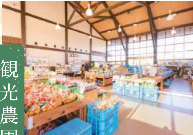
農園で採れた野菜や、その野菜を使った惣菜などが並びます。ソフトクリームやだんごを販売する売店もあります。