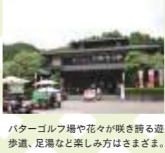
バターゴルフ場や花々が咲き誇る遊歩道、足湯など楽しみ方はさまざま。