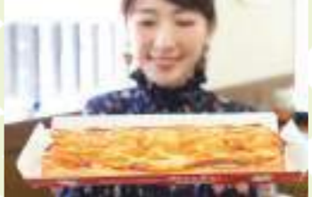
焼き立てのパンが約60種並ぶ「パン工房 平成」。2.5個分のりんごを使った「ロングアップルパイ」¥1,500など、お土産に喜ばれる面白いメニューもあります。