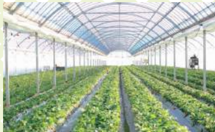
4種類ほどのイチゴを栽培。関市内や和菓子店など多くのお店にも卸しているのだとか。