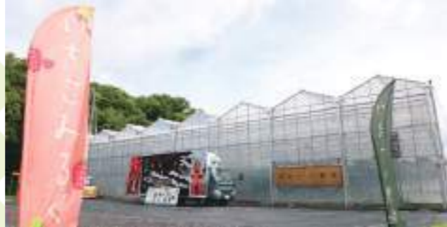
ハウス前のキッチンカーは夏季限定で、イベント出店を除くほぼ毎日営業しています。