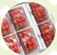
12月~5月は朝採りの新鮮イチゴがおすすめ。1パック¥400~

☎0575-23-9737 ● 関市東田原156-1 ● 10:00~15:00 ● 日曜、8~11月休業 ● 東海北陸自動車道関ICより車で15分 ● 10台