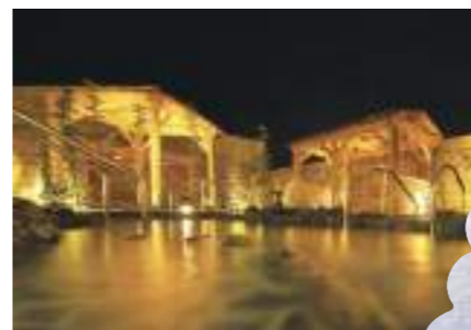
大きな岩と緑に囲まれた贅沢な露天風呂のほか、ちびっこ湯もあります。