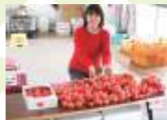
糖度9~10度のフルーツトマトは、甘みのほかに強いコクが味わえます。1パック¥1,000~