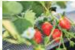
イチゴ「章姫・紅ほっぺ」の摘み取り体験も。(1月上旬~5月末) 大人¥2,200、小学生¥1,800、3歳以上¥800※5月は変更あり