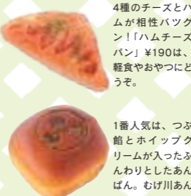
4種のチーズとハムが相性抜群!「ハムチーズパン」¥190は、軽食やおやつにどうぞ。

→P3でも紹介しています ☎0575-46-2696 ● 関市武芸川町跡部1810 ● 9:00~16:00 ● 木曜(祝日の場合は前日)、年末年始 ● 東海環状自動車道関広見ICより車で5分 ● 61台