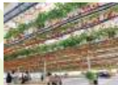
入場料¥1,500(4歳以上)、摘み取ったイチゴは量り売りで購入。アウトドアチェアなどのレンタルもあり、ピクニック気分がイチゴの食べ比べができます。