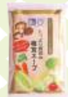
しいたけ園の原木しいたけと13種類の野菜を使用した「たっぷり野菜の椎茸スープ」¥1,190(30包入り)は、簡単アレンジレシピ付きでお土産にも喜ばれます。