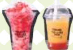
「いちごとオレンジ」¥400をはじめとするドリンクのほか、夏季には凍らせた果肉を削った「けずりいちご」¥700が登場。

☎公式HPまたはInstagramより問い合わせ ● 関市倉知字砂田2351-1 ● イチゴ狩り9:30~15:30(12月中旬~5月中旬予定)、キッチンカー 10:00~15:00 ● 不定休※イチゴ狩りは公式HPより要予約(当日予約可) ● 東海北陸自動車道関ICより車で5分 ● 14台 ● https://yamahei-noujyou.jimdofree.com/