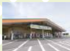
手づくりの惣菜や弁当、飛騨牛、乳製品、スイーツなど充実のラインナップが楽しめます。

☎0575-27-1255 ● 関市小屋名1436 ● 9:00~17:00 ● 火曜 ● 東海北陸自動車道関ICより車で5分 ● 302台