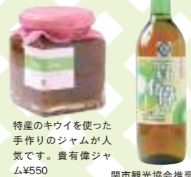
特産のキウイを使った手作りのジャムが人気です。貴有偉ジャム¥550

→P3でも紹介しています ☎0581-58-2940 ● 関市洞戸菅谷539-3 ● 8:00~16:00 ● 第2木曜、年末年始※12~2月は毎週木曜定休 ● 東海北陸自動車道美濃ICより車で20分 ● 50台